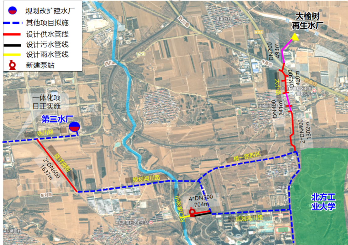
图 1 项目建设位置

沿大小路敷设供水管道，管径为 DN200-2*DN400。起点为横一路西延与大小路交叉口，终点为大榆树再生水厂，沿线预留支线接口。